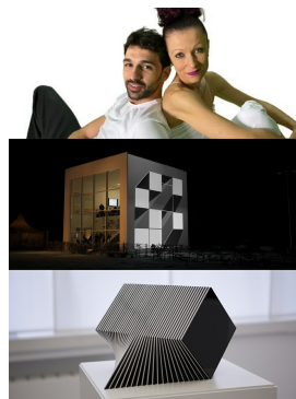
PEMAKultur digital